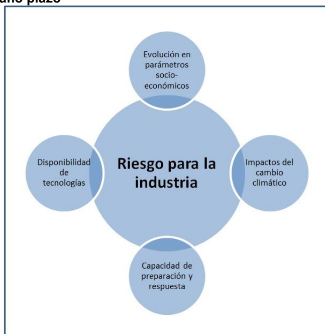
Figura 1: Determinantes del riesgo asociado con el cambio climático en el corto y mediano plazo

Del mismo modo, no ha sido posible obtener un panorama de las capacidades en términos de preparación y respuesta a los eventos climáticos. En consecuencia, suponemos que esas capacidades son limitadas, en comparación con las 'buenas prácticas' en otros países. 2 La implicación que de esto se deriva con respecto al análisis es la siguiente: se ha asumido que la